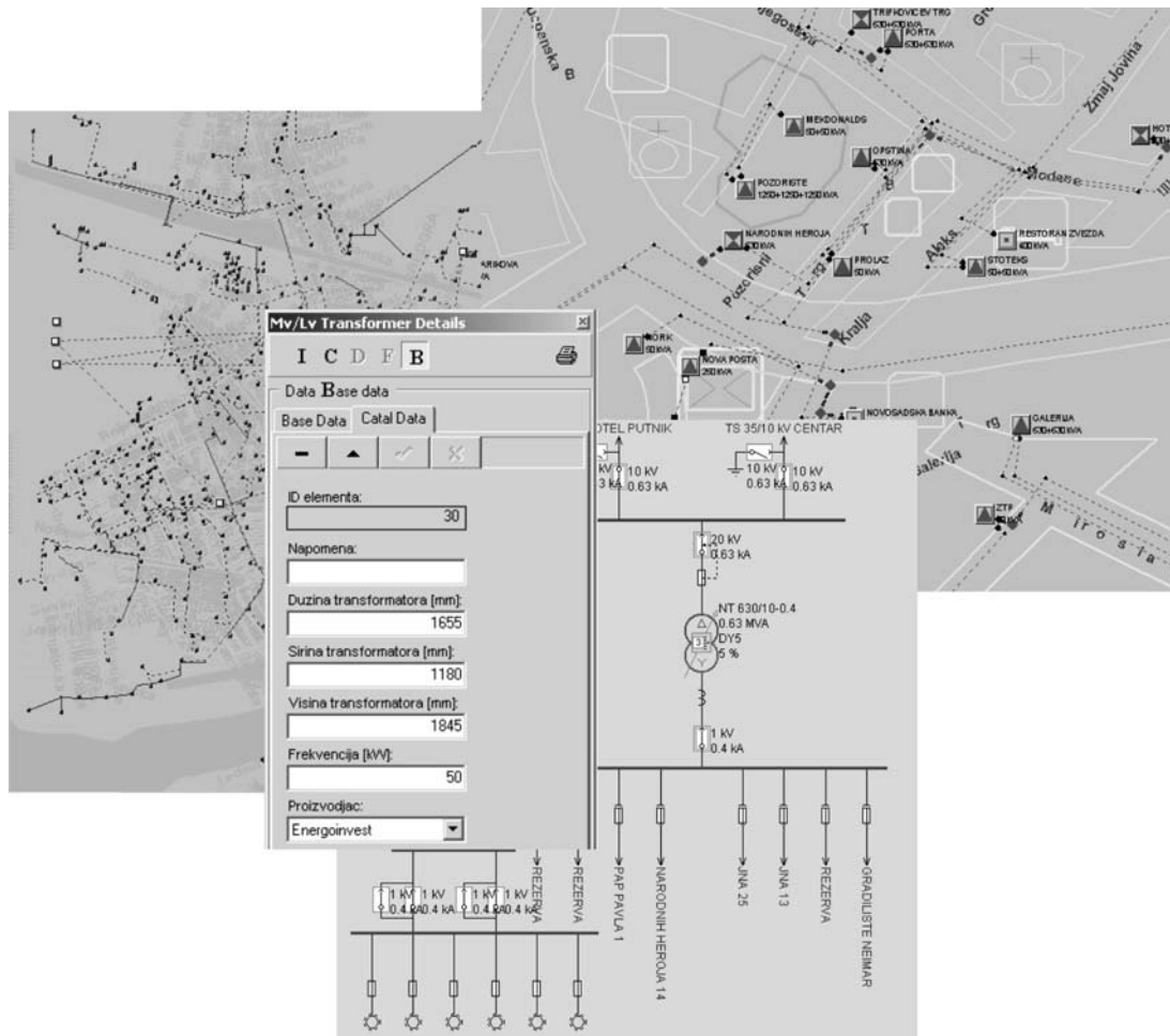
Slika 3 – Prikaz podataka o distributivnoj transformatorskoj stanici.

Editor geografskih šema SNDM u domenu zaštite podataka u potpunosti se oslanja na podsistem za autorizaciju realizovan u okviru projekta integracije EF i BTP i zaštitu podataka koju pruža sistem za upravljanje bazom podataka.